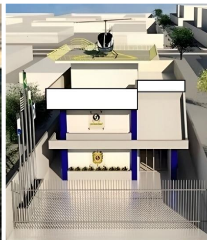
Sede Estadual - Pará