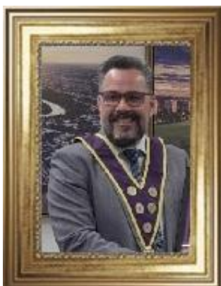
Senador Alan Rick