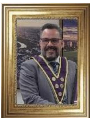
Senador Alan Rick