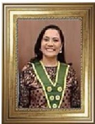
Gov. Mailza Assis