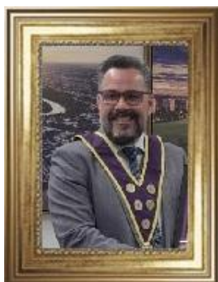
Senador Alan Rick