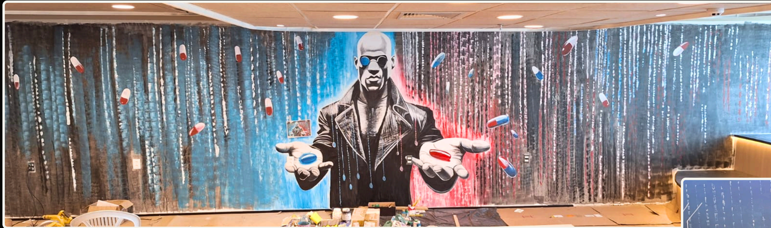
CYBEREYE - BRASÍLIA

O artista se dedica à realização de pinturas artísticas em paredes para transformar espaços com arte e sofisticação. Alguns dos ambientes atendidos: