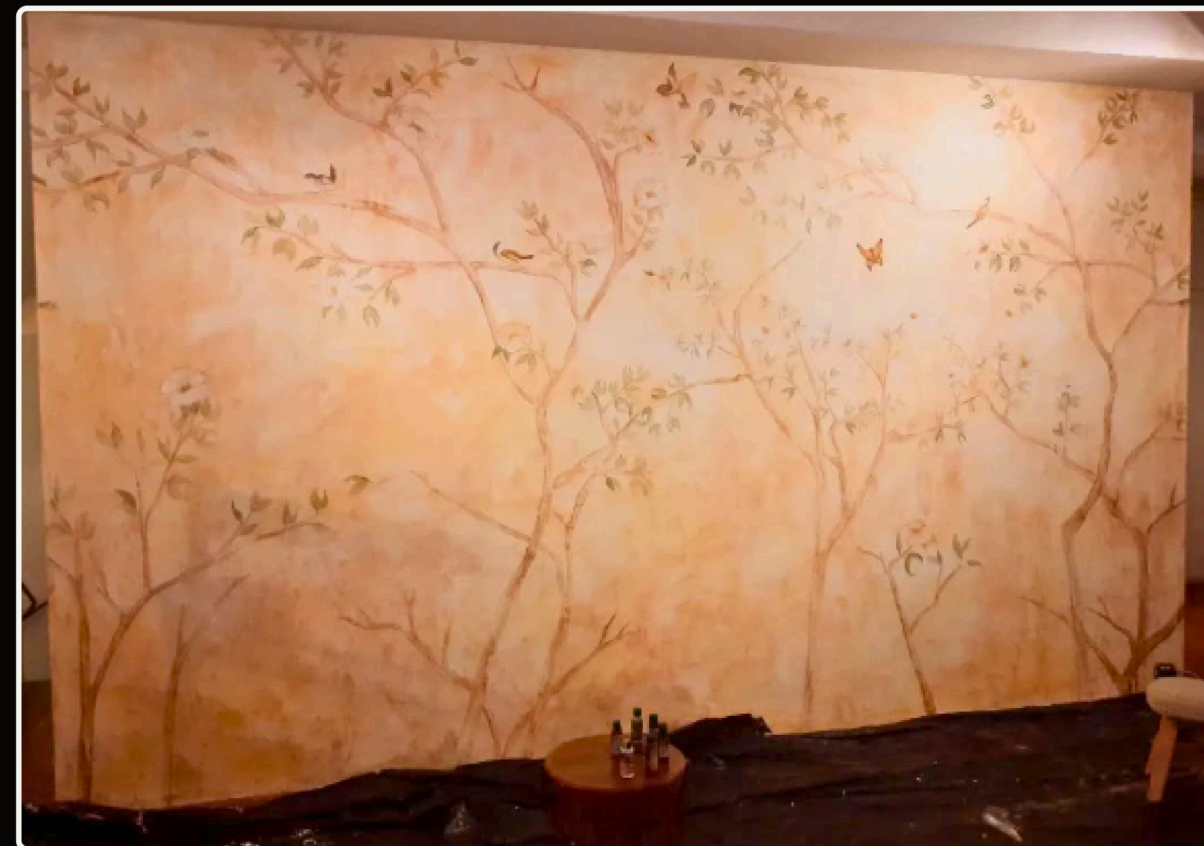
BARONESA VON LEITHNER CAFÉ E BISTRÔ - CAMPOS DO JORDÃO