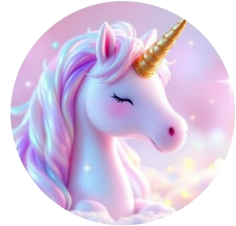
O Guardião da Esperança