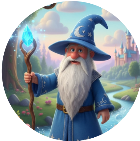
O Mago dos Sonhos