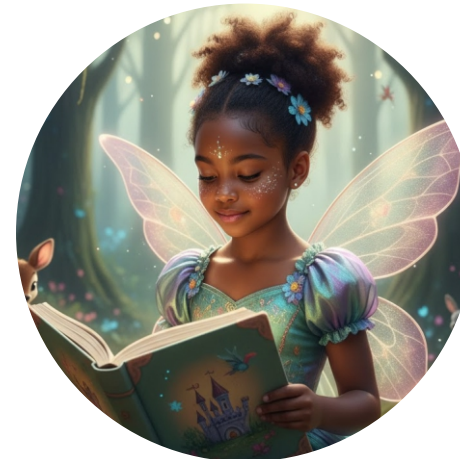
A Fada das Histórias