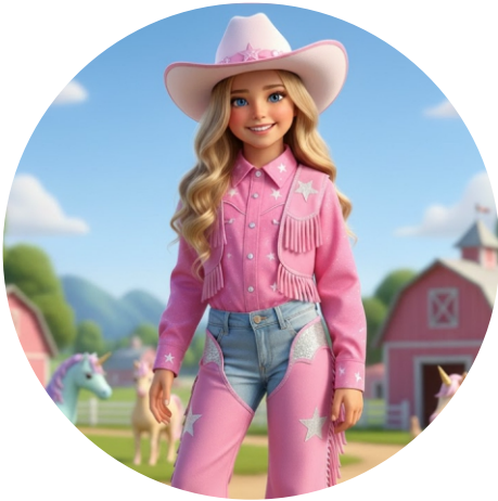
Rosa Sobre Rodas